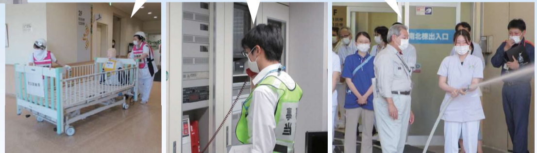
夜間検証 消火訓練

ます。防災センターでは総合操作盤の受信機による感知器発報確認後、出火場所への火災断定の確認連絡、火災通報装置で消防署への通報、非常放送による院内への周知、関係部署へ避難応援連絡等を行います。出火病棟は防災センターから火災確認の連絡を受け、出火場所の報告後、消火器具(15