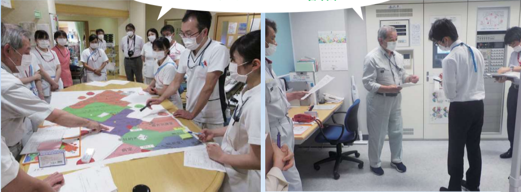
シミュレーション訓練

ます。防災センターでは総合操作盤の受信機による感知器発報確認後、出火場所への火災断定の確認連絡、火災通報装置で消防署への通報、非常放送による院内への周知、関係部署へ避難応援連絡等を行います。出火病棟は防災センターから火災確認の連絡を受け、出火場所の報告後、消火器具(15